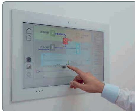
Auf einem zentralen Touch-Bildschirm lassen sich Informationen zum Energiemanagement abrufen

Dank dem Hauskonzept „Home4Future“ erreicht das Musterhaus den derzeit höchsten Energiestandard KfW 40 Plus. Grund hierfür sind die extrastark gedämmte Gebäudehülle „ÖvoNatur Therm“, eine PV-Anlage mit 28 Modulen (8,4 kWp), ein leistungsstarker Batteriespeicher (10,2 kWh) und die Haussteuerung WeberLogic 2.0, die bei der Kommunikation mit den einzelnen Elementen den etablierten EnOcean-Funkstandard nutzt. Damit ist ein reibungsloser Informationsaustausch sichergestellt. Mit der Haussteuerung lassen sich nicht nur sämtliche Lichter und Raffstores zentral steuern, auch ganze Szenen, Einzelraum-