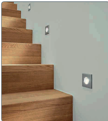
Im gesamten Haus lässt sich das Licht individuell per Schalter oder vom Smartphone aus steuern

Das elegante Stadthaus bietet 220 m 2 Wohnfläche auf zwei Vollgeschosse. Mittelpunkt ist der offene Wohn-, Ess- und Kochbereich. Essen und Wohnen gehen zwar ineinander über, sind durch eine optische Trennung dennoch separiert, denn eine Schrankwand dient als Raumteiler. Raumhohe Schiebetüren ermöglichen, den Wohnbereich komplett vom restlichen Haus abzutrennen. Zudem befinden sich im Erdgeschoss ein Gästezimmer sowie WC, Technikraum und ein flexibel nutzbares Zimmer. Die Massivholztreppe in Faltenwerk-Optik ist komplett unterbaut und bietet viel Stauraum. Im Obergeschoss wird man von einer großzügigen Empore empfangen. Die gesamte linke Seite steht den Kids zur Verfügung. Zwischen den beiden Kinderzimmern befindet sich das Kinderbad. Der Elterntrakt gegenüber umfasst rund 35 m 2 . Die Ankleide fungiert als Bindeglied zwischen Schlafbereich und Bad – die Durchgänge lassen sich auch hier durch Schiebetüren verschließen.