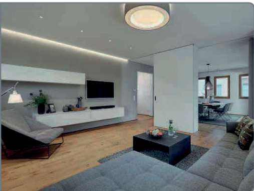
Der offene Wohnbereich lädt zum Entspannen ein. Per App oder Sprachsteuerung lassen sich Lichtszenen individuell von der Couch aus steuern

Temperaturregelung, Anwesenheitssimulationen und vieles mehr sind realisierbar. Von unterwegs können alle vernetzten Funktionen per Tablet oder Smartphone gemanagt werden.