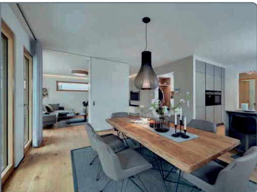
Mittelpunkt im Untergeschoss ist der offene Wohn-, Ess- und Kochbereich

Die innovative High-End-Lösung myHomeControl verfügt über weitere Funktionen wie Energiemanagement, Einbindung von Heiz- und Lüftungssystemen sowie Grundrissansichten. Auf einem zentralen Touch-Bildschirm wird beispielsweise angezeigt, wo im Haus Lichter an oder aus und Fenster offen bzw. geschlossen sind. Für mehr Sicherheit bietet das System einen intelligenten Einbruchschutz: Vor dem Verlassen des Hauses schaltet ein einziger Fingertipp die Alarmzentrale im Haus-Management-System scharf. Bei einem Einbruchversuch gehen alle Lichter an, die Raffstores fahren hoch und die eingebundene Musikanlage gibt ein lautes Alarmsignal von sich. Darüber hinaus ist die Haussteuerung mit dem Sprachassistenten Alexa von Amazon verbunden. Hervorzuheben ist die Anbindung an Apple HomeKit mit Siri. Die intuitive App ermöglicht eine kinderleichte Bedienung in vertrautem Apple-Design.